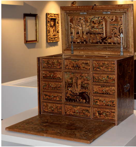
Figura 9. Escritorio de mesa. Taracea con escenas de caza y perspectivas arquitectónicas. Bartolomé Weisshaupt. 1556.

En una zona los cuadros al óleo de mayor formato. Dos son copias de grandísima calidad; una de la Piedad de Van Dyck que se haría mediante una estampa en la que estaba invertida, pero que tiene un brillante colorido que indica un conocimiento del original; otra es una copia antigua y de cierta calidad que reproduce la composición y color del Jesús entre los Doctores del círculo de José de Ribera.