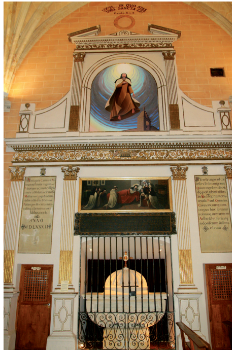
Figura 2. Retablo del anterior sepulcro de la Santa. La urna estuvo en lo alto (1615) y en el retablo mayor (1677-760). En 2003 se puso la pintura de Miguel Á.l Espí.

trasladada al interior del convento. En 2003 ha sido restaurada e instalada tras la reja del coro primitivo (unos metros debajo de su emplazamiento original) y en 2014 se ha instalado en lo alto de este retablo de piedra uno óleo sobre tabla, Glorificación de santa Teresa de Miguel Ángel Espí (el boceto está en el Museo).