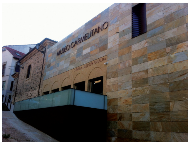
Figura 3. Museo Carmelitano Teresa de Jesús en Alba (CARMUS). Arquitecto Jesús Gascón Bernal