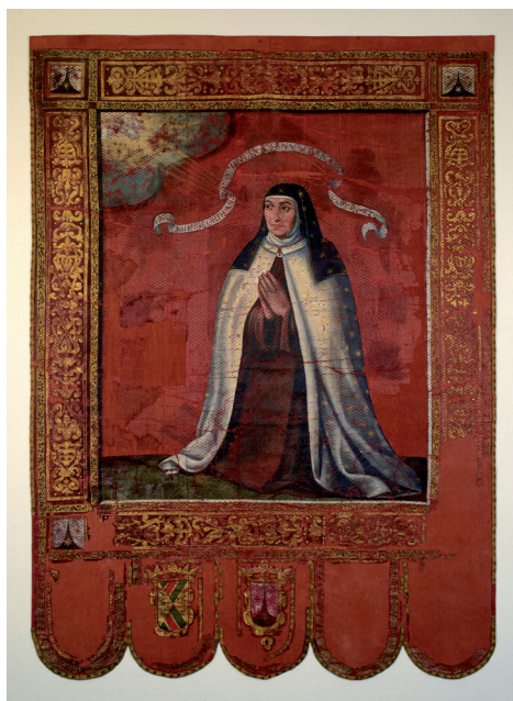
Figura 10. Estandarte de Canonización en seda y óleo. Estuvo en el Vaticano 1622, y luego en el centro de la iglesia de Alba.