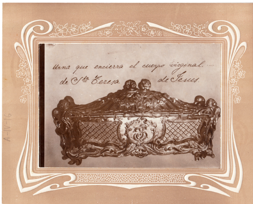
Figura 6. Urna de plata en la que está el cuerpo de la Santa, dentro de la urna de mármol. Orleans 1759.

y trazada por Jacques Marquet («J. Marquet delineavit, anno 1759, et inventit», dice en su tapa frontal) 29 . Dentro, el cuerpo está en una caja hecha en Orleans, que era «de plata, ricamente adornada de realce de la misma materia, con el anagrama real en su frente (sic), forrada toda por dentro en terciopelo carmesí» 30 , de la que aquí se adelanta una imagen de 1914 procedente del archivo conventual.