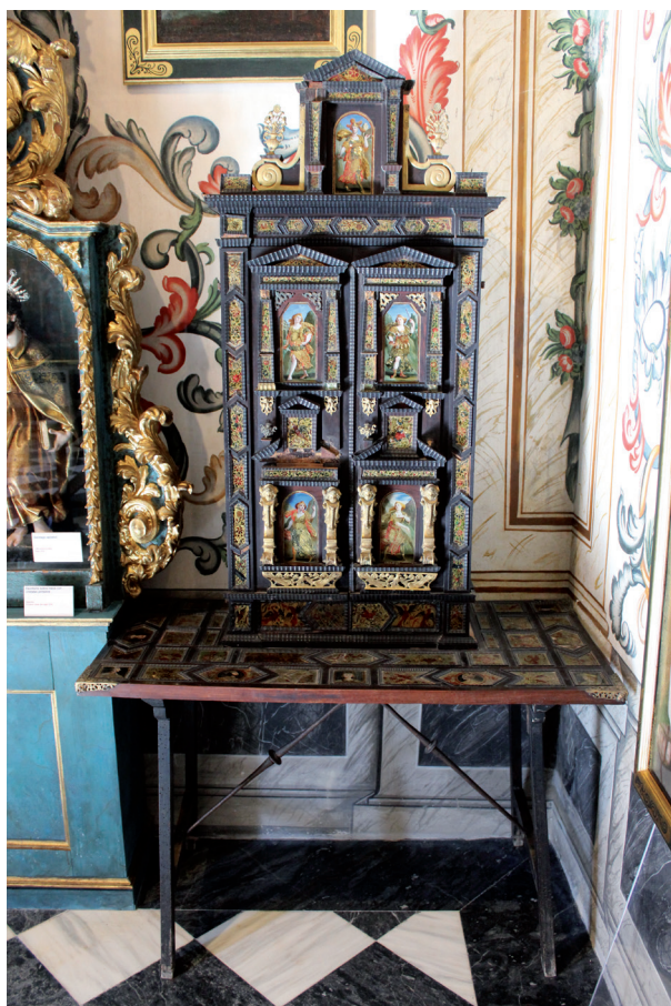
Figura 5. Stipi y bufete spagnolo de Vittore Billa. Nápoles, primer cuarto del XVII.

Singulares son dos escritorios napolitanos de la década de 1630 conocidos como stipi, con bellísimos cristales pintados, representando alegorías de las artes y las ciencias. Deben ser ejemplares únicos en España y muy raros en Europa. Únicos por su forma, ya que son cortos en su base y muy altos, se decoran con escenas de vidrio pintado, y conservan la mesa (bufete spagnolo se llaman) original con cristales pintados incrustados, que recogen los perfiles de los distintos reyes de Nápoles del XIII al XV. En la esquina inferior izquierda de cada uno de estos cristales aparece el anagrama VBL que debe corresponder a Vittore Billa 26 . La