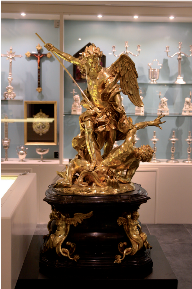
Figura 8. Alessandro Algardi. San Miguel venciendo al diablo. Bronce y oro molido.

De bronce y oro molido es un extraordinario san Miguel venciendo al diablo en composición agitada y expresiva, que ocupa el centro de la sala y reproduce el bronce del Museo Cívico de Bolonia (catálogo de Montagu nº 65), por lo que no dudo en incorporar la pieza al catálogo de Alessandro Algardi 36 . Creo que la fundición le da a este de Alba un aspecto más más grato, y el oro molido le da