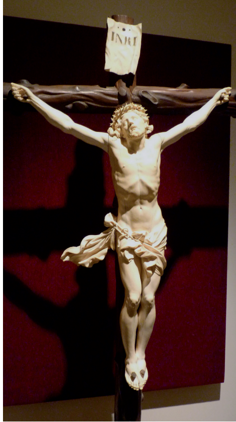
Figura 7. Cristo de Marfil. Atribuido a Alessandro Algardi

se conserva un cuadro de Andrea Sachi con la canonización de san Felipe Neri, muy distinto de los otros cuatro). Todo el protagonismo cae en los impulsores de las canonizaciones: el papa Gregorio XV que muestra el texto que incluye a Teresa en el Catálogo de los santos y especialmente su joven sobrino, cardenal y arzobispo de Bolonia, Ludovico Ludovisi, que ocupa el centro de la composición. Les rodean representantes de la nobleza española y frailes carmelitas que portan el estandarte de la nueva Santa.